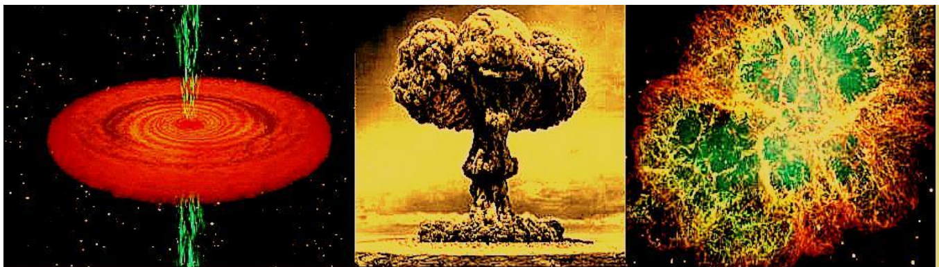
Ilustración 7: Aplicaciones de la fantasía de Einstein

El paradigma generado por Einstein, utiliza como base los enunciados básicos del paradigma de Newton, donde coexiste el espacio continuo y el tiempo continuo para ordenar los eventos. Pero debido a la relatividad asociada a los observadores, dicho ordenador pierde su potencial, dejando indefinido la escritura de un tiempo histórico universal de los eventos en el suprauniverso, pues el tiempo puede hasta congelarse y no existe el observador universal que controle el tiempo universal.