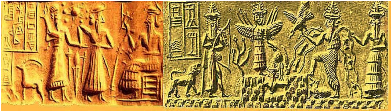
Ilustración 5: Tablillas sumerias

La complejidad que envuelve la existencia de los humanos, va más allá de su propia existencia, inclusive la forma en que se creó el planeta Tierra posee varias propuestas, que son tan diferentes como las de la creación del hombre.