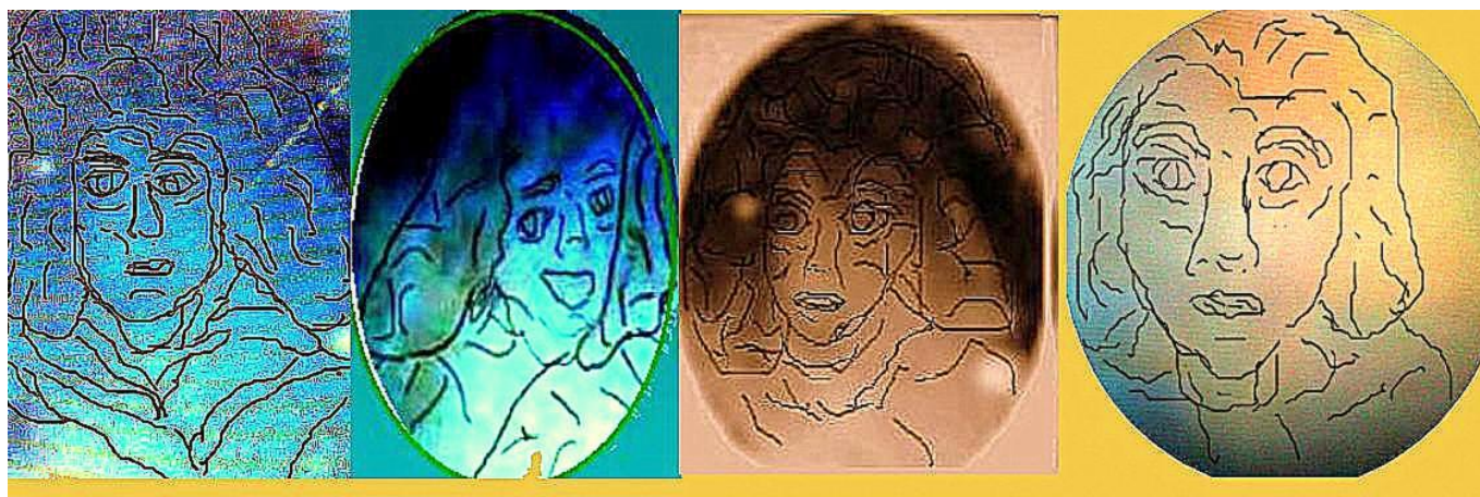
Ilustración 9: Psicoimágenes de rostros

El paradigma propuesto en el Libro de Atom , se sale del marco de las fantasías matemáticas anteriormente mencionadas, pues desecha la existencia del tiempo y basa el estudio del todo en los eventos generados por el todo, involucrando diferentes tipos de superejes formados por microretículos, que son los responsables de la generación de las zonas permitidas para eventos en donde la interacción de los entes queda atrapada en la historia del suprauniverso. Para el modelo de los eventos es fundamental la existencia de una malla dimensional sobre la cual los entes se transfieren a zonas probabilísticas donde se puede generar un evento, sin perder la esencia propia del mismo.